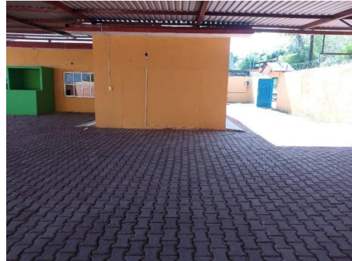
Grupo de trabajo 1. Punto de recuento No. 3