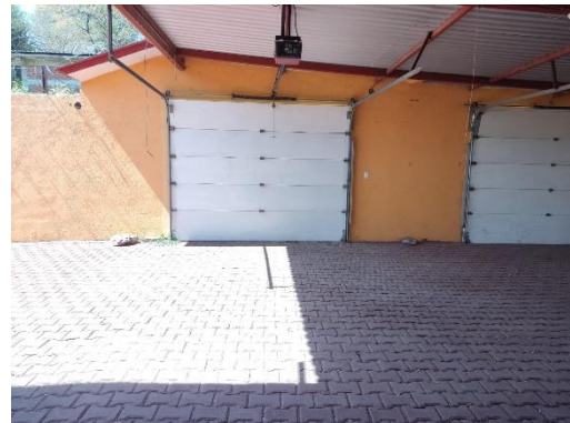
Grupo de trabajo 1. Punto de recuento No. 4