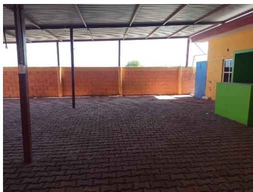
Grupo de trabajo 1. Punto de recuento No. 1