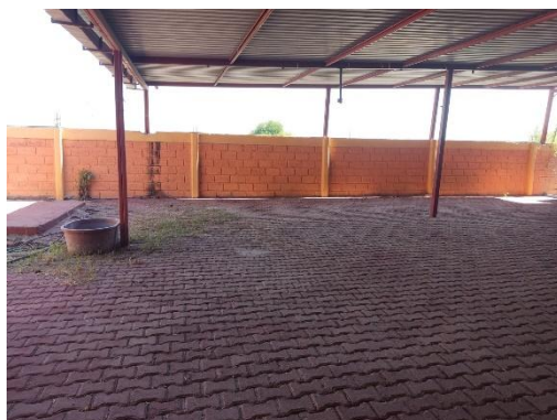
Grupo de trabajo 1. Punto de recuento No. 2